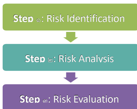
รูปที่ ๑ กระบวนการดำเนินการประเมินความเสี่ยง

การประเมินความเสี่ยงนั้นเกี่ยวกับการระบุความเสี่ยงที่เฉพาะเจาะจงกับสภาพแวดล้อม และการกำหนดระดับของความเสี่ยงที่ระบุ ขั้นตอนหลักในการประเมินความเสี่ยง ได้แก่ การระบุความเสี่ยง (Risk Identification) การวิเคราะห์ความเสี่ยง (Risk Analysis) และการประเมินความเสี่ยง (Risk Evaluation)